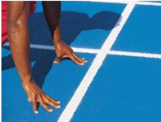
圖 2.3 賽跑 Figure 2.3 Race