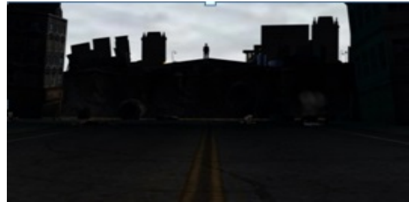
已被破壞城鎮街道3