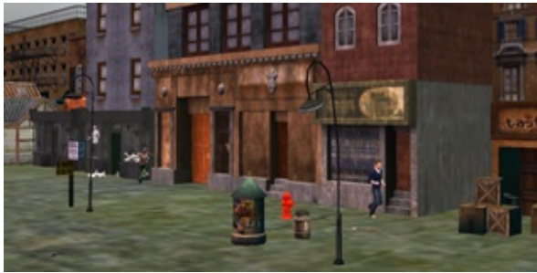
已被破壞城鎮街道2