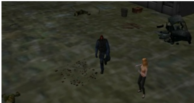
已被破壞城鎮街道1